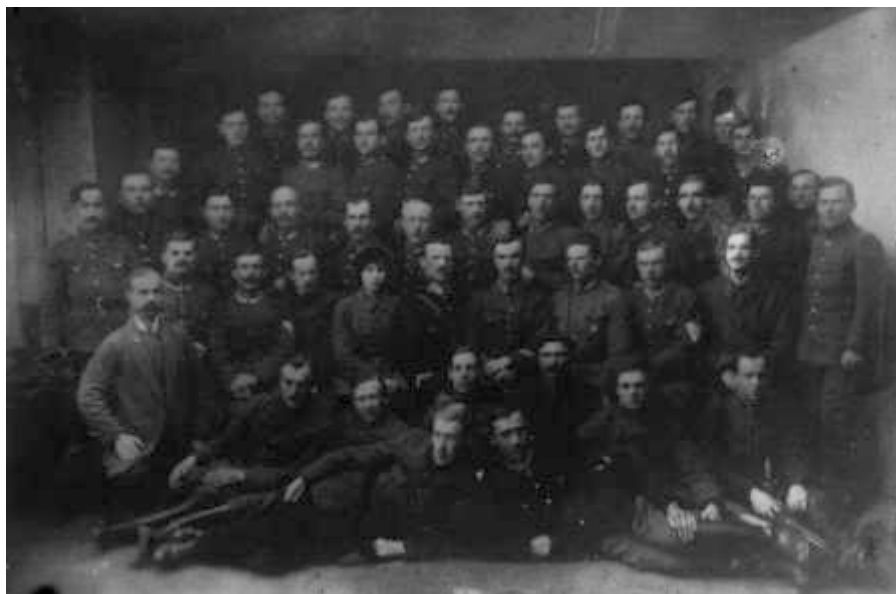
Funkcjonariusze PP z powiatu Biała Podlaska, ok. 1925 r.