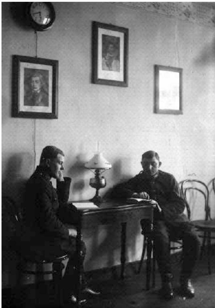
W świetlicy policyjnej, 1925 r.

Stowarzyszenie prowadziło świetlicę przy posterunku policji w Białej Podlaskiej. W celu dobrej pracy tej świetlicy założono 1 listopada 1924 r. „Koło Świetlicy Policyjne” i zorganizowano przy niej bibliotekę.