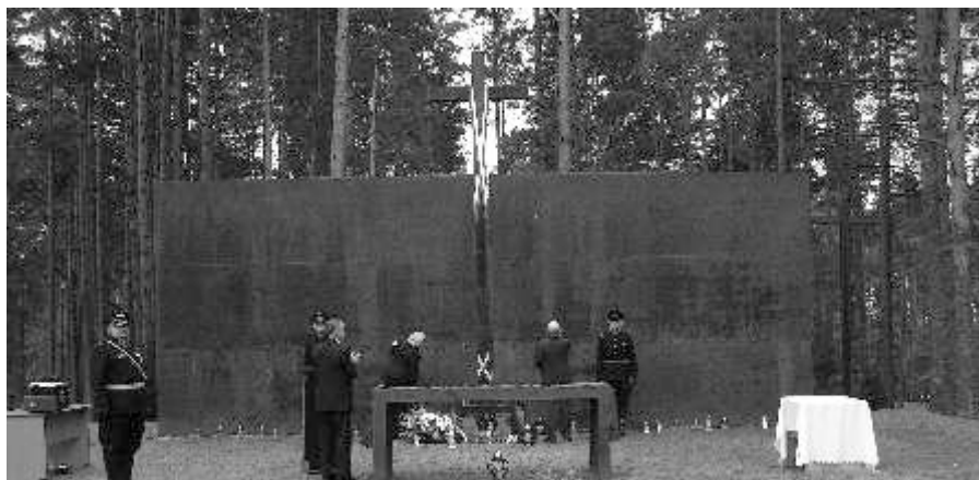
Cmentarz w Miednoje, stan obecny.

W latach 1940-1990 władze radzieckie zaprzeczały, aby były odpowiedzialne zbrodnię katyńską. 13 kwietnia 1990 r. przyznały, że była to „jedna z ciężkich zbrodni stalinowskich”. W latach 1999-2000 z inicjatywy Rady Ochrony Pamięci Walk i Męczeństwa w Miednoje powstał Polski Cmentarz Wojenny. Na łącznej powierzchni 1,7 ha znajduje się na nim 25 zbiorowych mogił jeńców obozu w Ostaszkowie. 14 listopada 2007 r. Sejm RP ustanowił przez aklamację 13 kwietnia Dniem Pamięci Ofiar Zbrodni Katyńskiej.